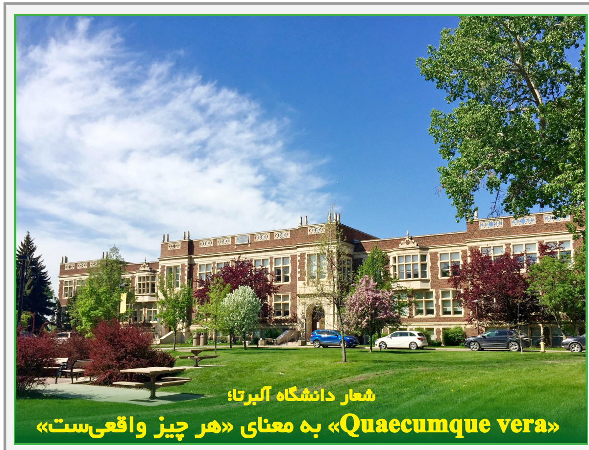
شعار دانشگاه آلبرتا؛

«Quaecumque vera» به معنای «هر چیز واقعی است»