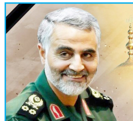
سردار دلها جاودانه شد

فراخوان نهمین جشنواره سراسری فیلم کوتاه و عکس دانشجویان (امید)