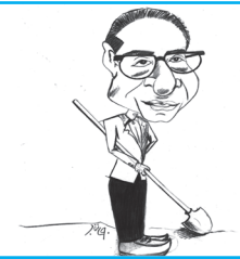
ماجراهای آقای نیرنگ زاده